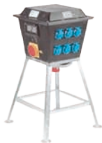
zwerfkast / paddenstoel