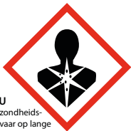
MU gezondheids- gevaar op lange termijn