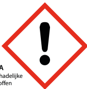
DA schadelijke stoffen