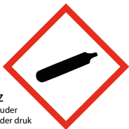
GZ houder onder druk