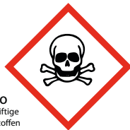
TO giftige stoffen