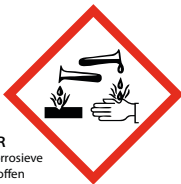
CR corrosieve stoffen