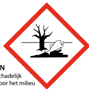
EN schadelijk voor het milieu