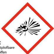
EX ontploffbare stoffen

Werk uitsluitend zoals is aangegeven in de gebruiksaanwijzing en raadpleeg het veiligheidsinformatieblad.