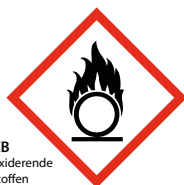
CB oxiderende stoffen