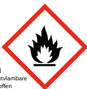
IN ontvlambare stoffen